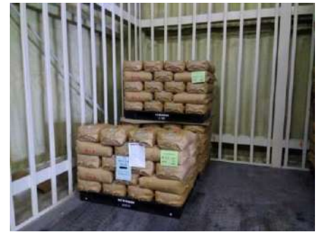
貯蔵庫の昨年産「秋の詩」も残りわずか。