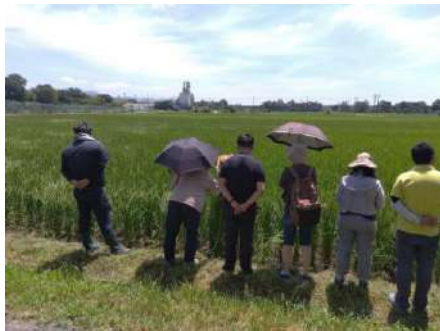
圃場で稲の生育状況を視察。