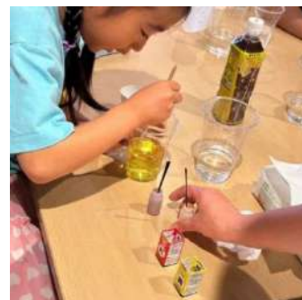
食品添加物を使って、ジュースを作りました。