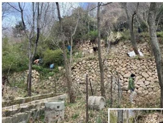
2月に行った草刈りで、隠れていた「遺構」が姿を現しました。

水車くるくる講座に参加されたことがご縁で、アドバイザーとして関わっていただいている、この制度に詳しい方の力添えもあり、また、兵庫県勤労者山岳連盟自然保護委員会のみなさんや