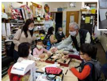
←大人も子どもと一緒に(こもれどで)

った方たちが会員となり、得意なこと、できることを持ち寄り、楽しく生き生きと活動されているのが印象的でした。