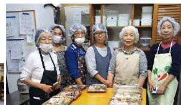
↑あたふたクッキングのみなさん