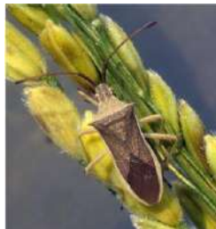
出穂したイネと、それを好むホソハリカメムシ