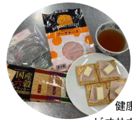
健康おやつで ビオサポタイム