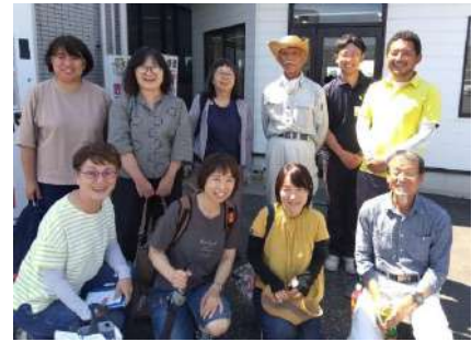
視察先で生産者のみなさんと。

昨年は梅雨が長かった上に猛暑で稲が育たず、いもち病や縞葉枯病、カメムシの被害が発生して収量が減った事もありますが、 よやくる での登録と自由注文で安定した利用が続いている為、貯蔵庫の竜おうみ米の在庫はあとわずかでした。今、圃場で育つコメが新米として出る頃までの在庫は確保されているそうです。