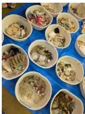
見つかった大小のゴミ