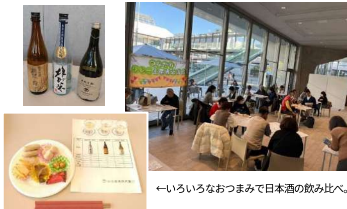
←いろいろなおつまみで日本酒の飲み比べ。