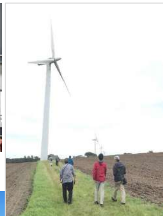
サムソ島の風車と 太陽光パネル