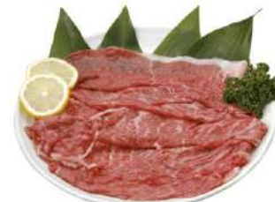
和牛おすすりスライス 270g