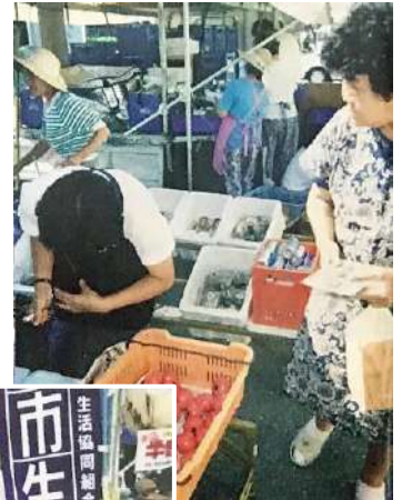
↑ポートアイランドでの移動青空市。