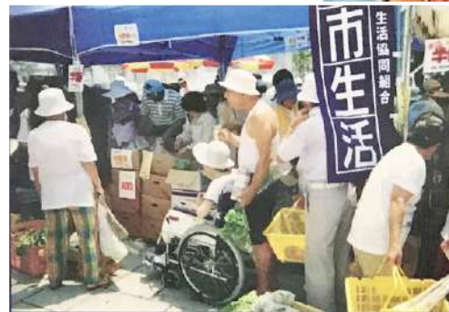
←六甲アイランドでの大青空市。

れました。現在は生活クラブの仲間となっているエスコープ大阪や、京都エル・コープからの助っ人の職員さんと都市生活の職員、ポートアイランド在住の組合員4名程とで毎週水曜日に回りました。1年程続けたと思います。