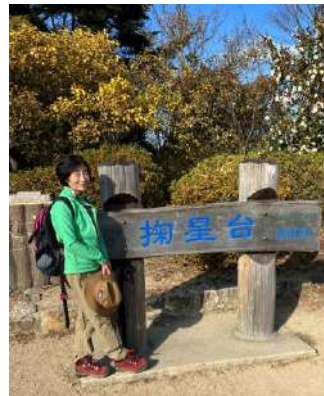
天気のいい12月の日曜日、摩耶山にて。

震災後の春頃から、ポートアイランドに出来た3か所の仮設住宅を対象に消費材を販売する青空市を行いました。全国の生協仲間から届けられたカンパを活用して、仮設の皆さんに、2割引で販売。スーパーが遠かったり、移動が大変な人に喜ば