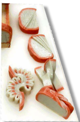
かまぼこの飾り切り実演も。