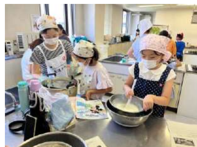
新生酪農交流会ではアイス クリーム作り。

4月から毎月開催している「絵本とおやつひろば」では、月 毎にテーマを決めて選書し、読み聞かせをしています。司書さ んや保育士さん、地域で読み聞かせをしている方がスタッフと して活動を手助けしてくれています。読み聞かせだけでなく、 ちょっとしたクラフト作りもしています。