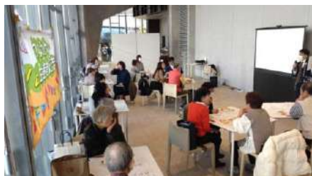
祝日に行った山名酒造 交流会は盛況でした。

山名酒造との交流会は、はじめて祝日の午後に開催し、今まで お会いする事がなかった多くの組合員さんに出会えました。 夏休みには新生酪農との交流会を開催して、たくさんの親子組 合員さんとアイスクリーム作りができました。