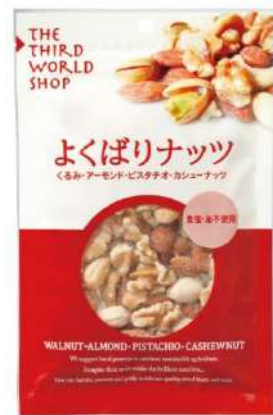
消費材名は「ミックスナッツ」