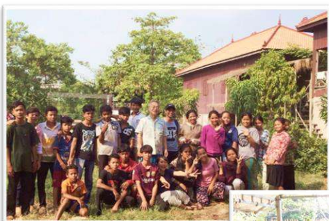
(上)プーンアジの仲間たち。

カンボジアでは以前より栽培されていましたが、殻ごと安価で取引されていました。地元で加工することで仕事を創り、栽培から商品化までカンボジア人の手で一貫して行い、持続可能なビジネスとしての仕組みづくりを行っています。