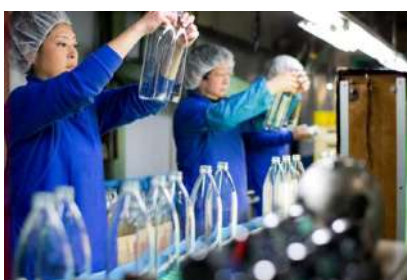
洗浄後の目視検査