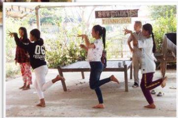
(下)伝統舞踊の継承も。