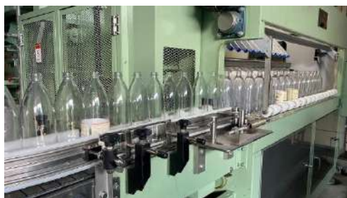
洗びん機を流れるRびん

『グリーンシステム』は、びんに詰めて生産から最後まで責任を持つ素晴らしい仕組み。Rびんを洗浄している我々だけでなく、Rびんの消費材を利用する組合員、Rびんを使っている生産者の理解と協力のもと成り立っています。そのことを忘れずに、使ったら返す。地道なことだが、やり続けている事はとても大きい。あなたの周りの人に『グリーンシステム』を広めてください。