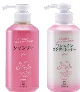
エコーレア化粧品 (左) シャンプープラス 500ml (右) リンスインコンディショナープラス 500ml

髪の毛の傷みが気になる方はぜひ一度エコーレア化粧品のシャンプープラスとリンスインコンディショナープラスを使ってみてください。やさしく頭皮までスッキリ洗えるせっけんに、心安らぐワイルドローズの天然精油の香りが配合されています。傷みが気になる時はしっかりとした量のリンスインコンディショナーで蒸しパックがおすすめ、しっとりまとまる髪に整えてくれます。髪を集中ケアしてうるおいとツヤのある健康な髪を目指しましょう！ (せっけんクラブ 志方洋子)