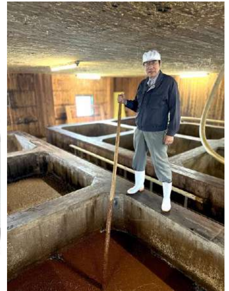
杉で作られた醸造蔵で。

このように都市生活さんとの取引は勉強続き。遺伝子組み換えや環境ホルモンの勉強、果ては淡口しょうゆ開発のため、生協の本部センターで大きなタンクに醤油を仕込み、色の具合を見る取組みもしました。生産者と組合員が、互いに高め合っていける関係をいつまでも続けてほしいと願っています。