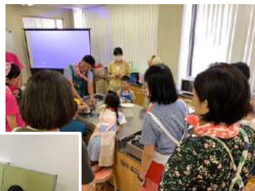
↓みんなのひろば ちくちく倶楽部「簡単な刺繍にチャレンジ」