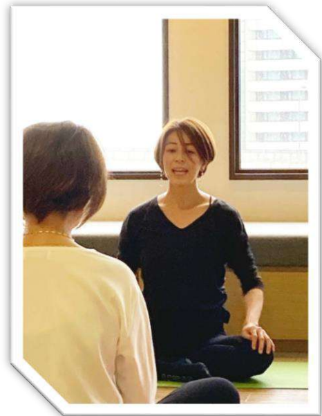
エッコロ講座にて。