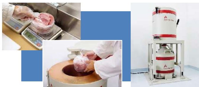
高精度な検査が可能なゲルマニウム半導体検出器で検査しています。

東京電力福島第一原発事故による放射能汚染の懸念についても、放射能検査結果をデータベース化し、いつでもアクセスできる形にしています。関西の消費材についても毎年放射能検査を行っており、生活クラブ生協都市生活のウェブサイトに掲載しています。(2ページ参照)