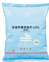
洗濯用無添加せっけん(針状)