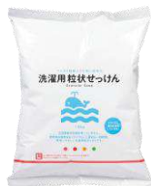
洗濯用粒状せっけん