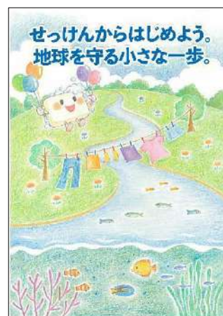
2022年度シャボン玉月間ポスター

地域生協、大学生協、NPO、市民団体など、おおぜいが参加できるせっけん運動のネットワーク組織です。せっけんを入口として環境問題全般に広く関心を持ち、相互交流をはかり、地域におけるせっけん運動の発展をめざします。