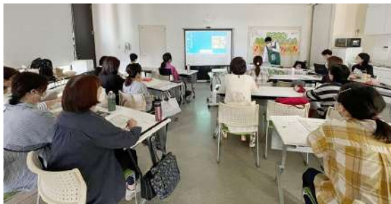
チョコレートを使ってスイーツ作りの実演も。