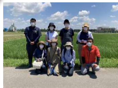
大豆播種見学でメンバーと訪れた竜王町で。