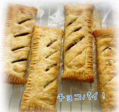
パイシートでチョコを包むだけ!

=RSPO認証= RSPO(持続可能なパーム油のための円卓会議)は、持続可能なアブラヤシ製品の成長と使用を促進することを目的として設立された組織で、月島食品はこの認証を受けたパーム油を使用しています。