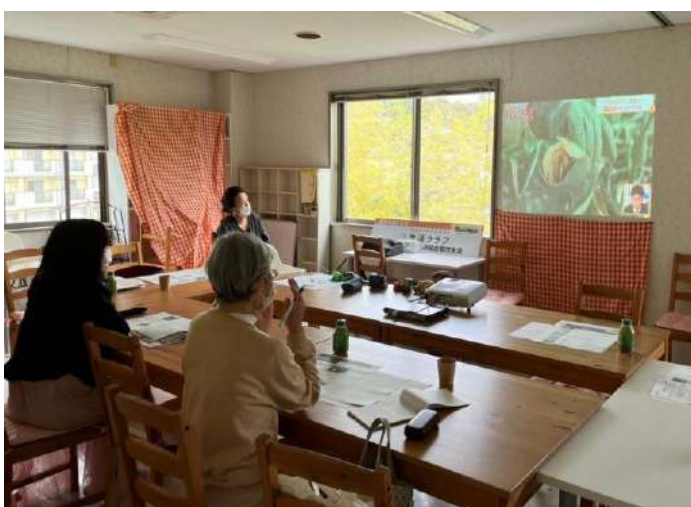
毎月、モニットを対象に行う支部ミーティングの様子