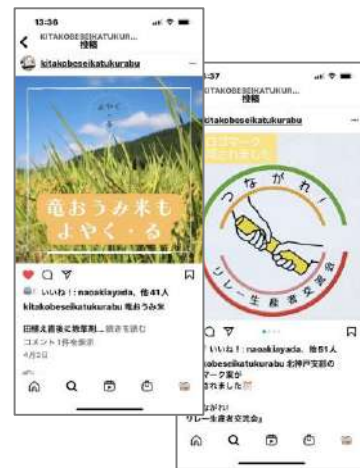
Instagram では、生活クラブの魅力を発信。