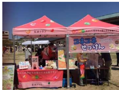
ロハスパーク川西せせらぎ公園で。

組合員スタッフは、「生活クラブでは水環境をまもるため、せっけんの利用をすすめている」ことを伝え、コネコネせっけんコーナーを担当。職員は、みかんジュースや牛乳の試飲をすすめ、消費材や生活クラブについて紹介や説明をし、その場で加入手続きもできるようにしています。