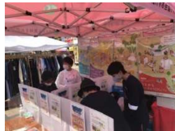
ロハスパーク神戸西で。

今後、スタッフも機関紙都市生活やチラシで募集していきます。一緒に、生活クラブを知らせて、仲間づくりをしていきましょう!