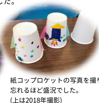
紙コップロケットの写真を撮り忘れるほど盛況でした。(上は2018年撮影)