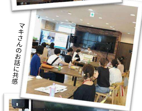
マキさんのお話に共感