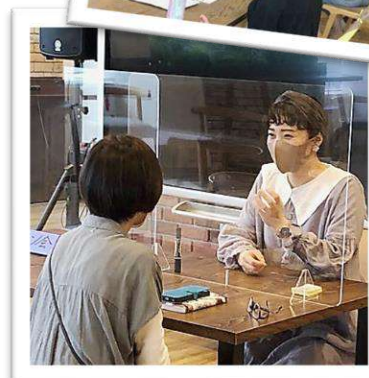
講演会あとにはサイン会も