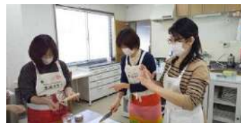
おやつ動画、撮影中!