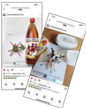
ムシロボットはInstagramでも発表！