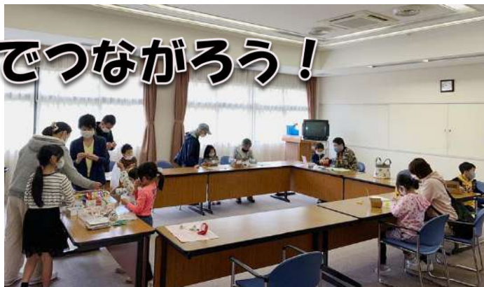
親子で楽しく、ムシロボット作りにみんな夢中！

緊急事態宣言等で、公民館などの会場が借りられないという状況が多くありました。実開催ができない分、InstagramやFacebookなどSNSの活用や支部機関紙で紙上による支部ミーティングでクイズやアンケートを実施し、告知や報告を行いました。いろいろな形で情報をお届けし、つながるきっかけになるよう取り組んでいます。