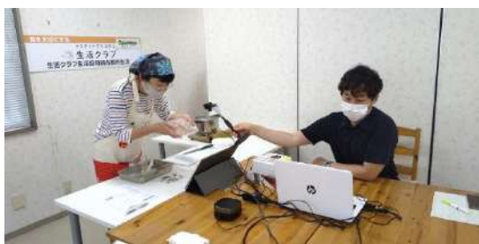
参加者によくわかるよう、手元をカメラで映します。

秋以降は、おやつや食品添加物、野菜の冷凍術などをテーマに、オンラインで行う「食育セミナー&クッキング」を開催していく予定です。食育スタジオから遠くて来られない方や、小さいお子さんがいらっしゃる方も気軽に参加してください。毎日の食事作りに役立つアイデアがいっぱいです。