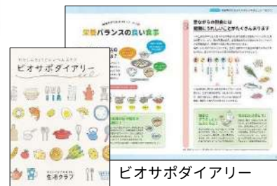
バイオサポダイアリー