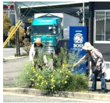
セイヨウナタネの大きな株を抜きました。

2005年から毎年続けている、遺伝子組み換え(以下GM)ナタネ自生調査を、今年も実施しました。輸入ナタネの多くはGMです。種の形で輸入されたナタネが、工場に運ばれるパイプラインからこぼれ落ちたり、そこから各地に輸送するトラックのタイヤに付いたり風で運ばれたりして拡散してしまいます。近縁種のアブラナ科植物と交雑してGMの性質を引き継いでしまう可能性があり、私たちはGMナタネが広がらないよう、監視活動として調査を続けています。