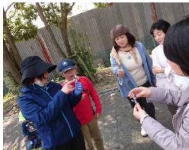
こちらは全て陰性。ホッ！

愛菜会の畑では、それらしい葉が見え始めたレタスの畑と、ハウスですくすく育つトマトの苗を見学しました。お疲れモードの子どもたちもこの時ばかりは興味津々でした。