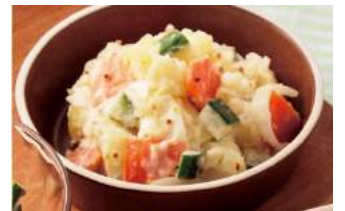
「ヨーグルト入りポテサラ」 ビオサポレシビより