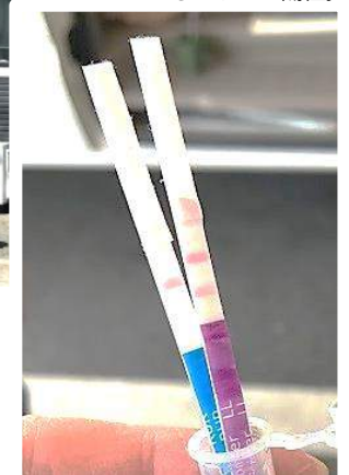
右の2本線が出ているのがGM陽性。