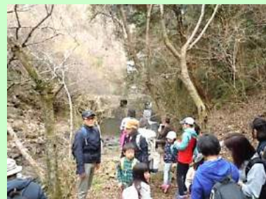
取水地点付近まで、子どもも頑張りました。