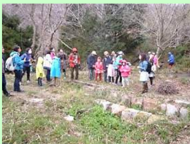
昔の水車があった場所を見ました。