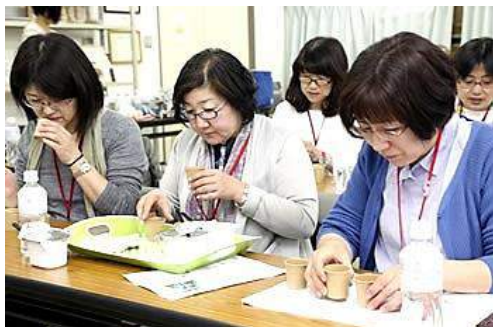
乳酸菌の学習会で、味比べ。意見や要望も出しました。

4月の新生酪農千葉工場の訪問からスタート。乳酸菌の学習や製造工程の見学等を行いました。原料が同じでも乳酸菌によって仕上がりの風味が全く異なることにはびっくり。また、工場の設備や製造能力には限りがあることも、現地を訪問してわかりました。