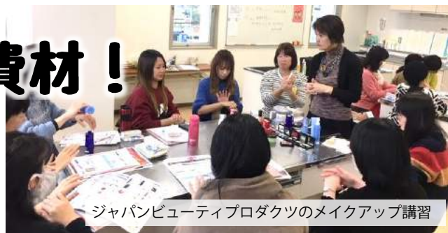
ジャパンビューティプロダクツのメイクアップ講習

と今後は利用しようと思う。」と、意識が変わった組合員が多く、学習会の成果を感じました。