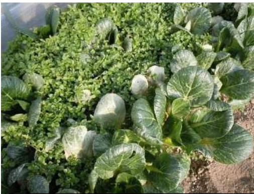
虫害で白っぽくなった小松菜