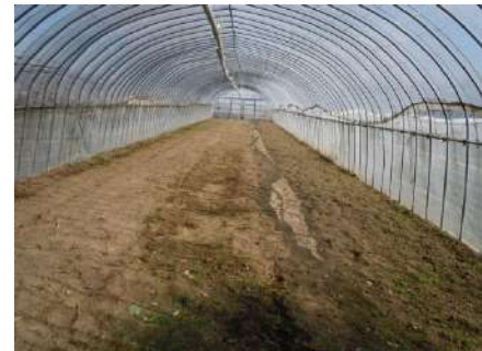
なーんにも \(\sim o \sim\) / なくなりました